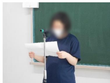
リモートでの発表の様子