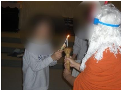
キャンドルサービス

花山宿泊学習では、熊の出没が心配されたため、ハイキングなどの屋外活動を変更し、体育館での風船バレーやボウリングを行いました。野外炊飯でのカレー作り、キャンドルサービス、焼き板作りなど仲間と一緒に活動する中で、協力することの大切さや相手を思いやる気持ちを学びました。事前に学んだルールを守りながら、安全に楽しく過ごすことができたことも、大きな成長につながったと思います。この経験を今後の学校生活に生かしていきたいと思います。