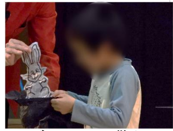
マジックショーの様子

芸術鑑賞会では、マジックショーを鑑賞しました。マジシャンの技を間近で見ることができ、驚きの表情を浮かべたり歓声を上げたりしながら、楽しい時間を過ごしました。修学旅行では、1日目に八木山動物公園と仙台市科学館を訪れ、2日目には仙台市天文台と仙台うみの杜水族館に行きました。事前に学んだルールやマナーをしっかりと守りながら、それぞれの施設で楽しく活動することができました。